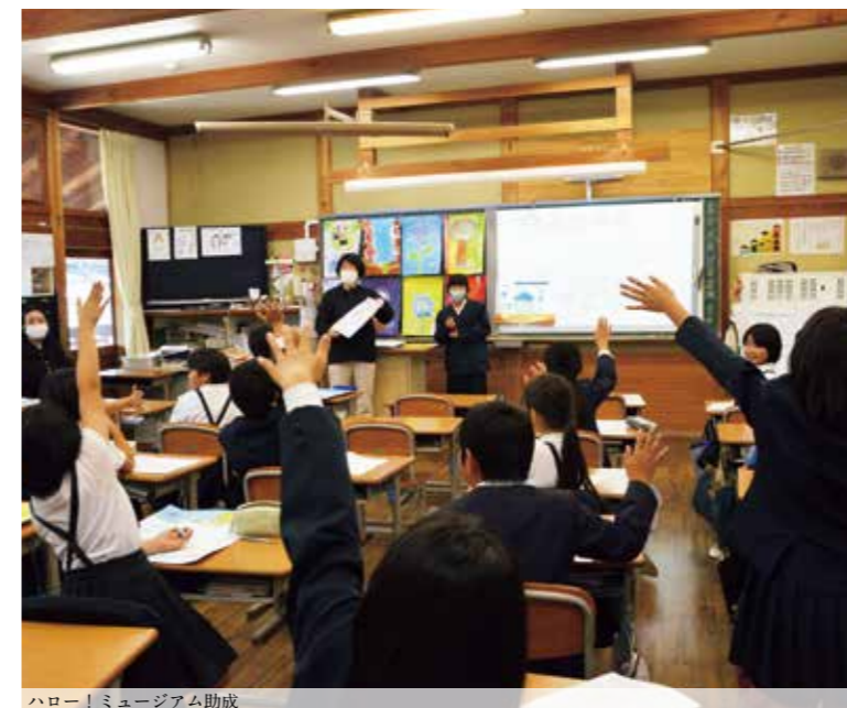
ハロー！ミュージアム助成

[先進的事業助成] 新たな教育文化的価値の創造に寄与する先進的かつ実践的な活動を行う団体等に対して助成しています。