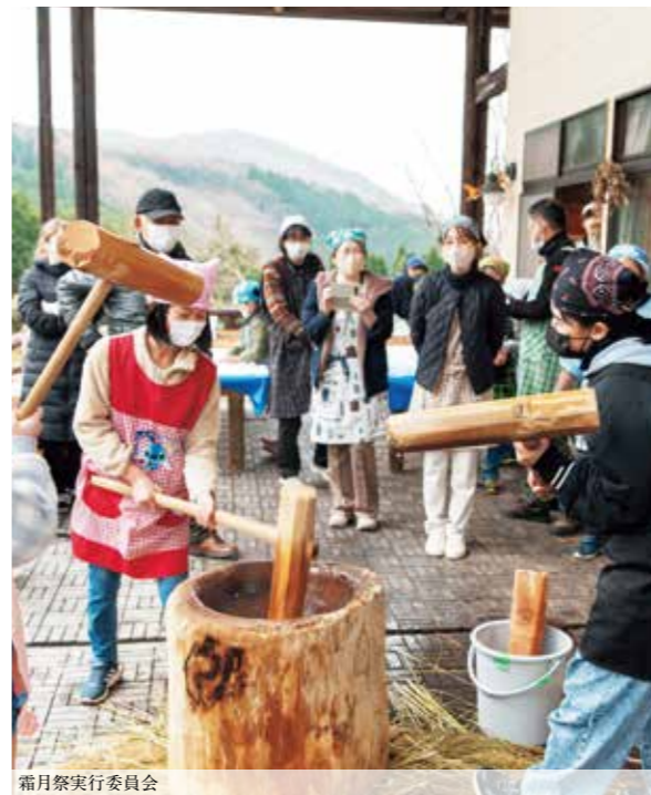
霜月祭実行委員会