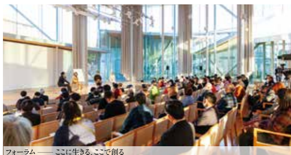
フォーラム —— ここに生きる、ここで創る

[フォーラム —— ここに生きる、ここで創る] 地域で活動をしている方をパネリストに迎え、講演やトークセッション、参加者による交流会を開催しています。