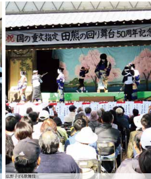
広野子ども歌舞伎