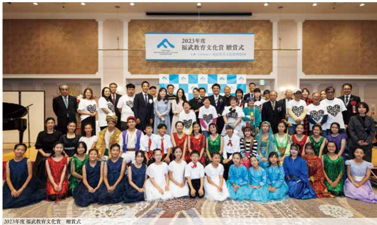
2023年度 福武教育文化賞 贈賞式