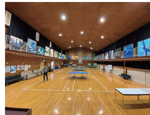
県北作家展（奥津公民館）