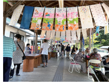
山の洗濯美術館（道の駅奥津温泉）