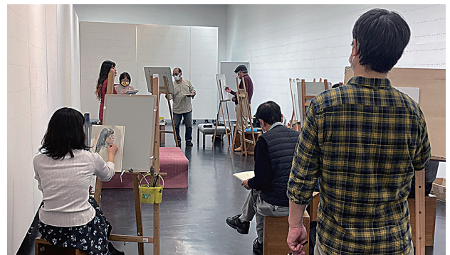
会員有志によるワークショップ