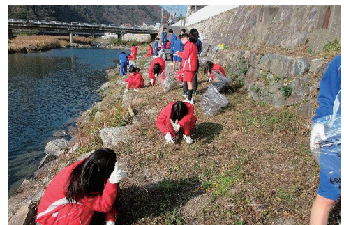
宇甘川土手の草抜き