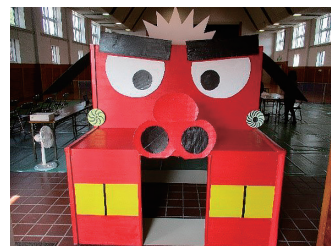
みつ公民館まつり

御津高ブースを設けていただき、獅子舞を伝える防災マップ、みつ検定等、ルネス学での作品やポスターを展示した。