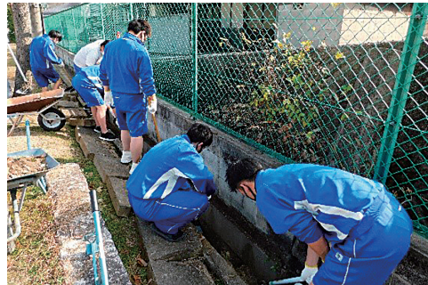
御津南小学校環境整備