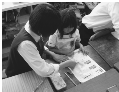
小学生の学習支援をする中学生